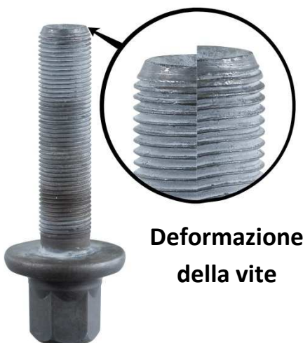
Deformazione della vite

La vite (vite + dado incorporato) è una M18 x 1.5 con una lunghezza massima di 85.5 mm . È imperativo installarla assieme alla rondella.