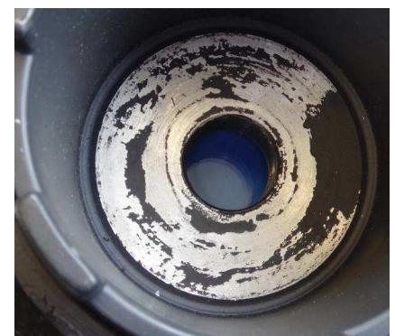
Faccia d'appoggio della rondella segnata a seguito di un funzionamento con gioco maggiorato

In caso di errato serraggio, la puleggia può diventare rumorosa.