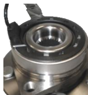
Ref. OE 96812619 R190.23